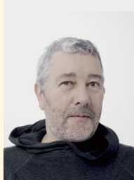
Philippe Starck Designer